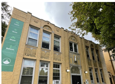
St. John Berchmans School 2511 W. Logan Blvd. Chicago, IL 60647